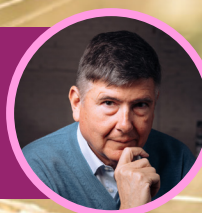
Manuel Pimentel Ex ministro de Trabajo y Economía Social